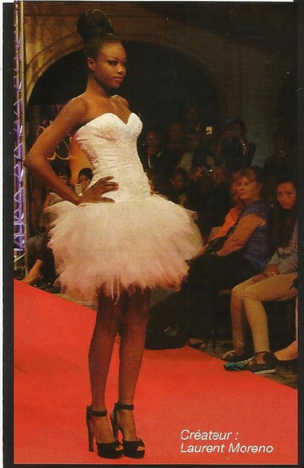
Créateur : Laurent Moreno